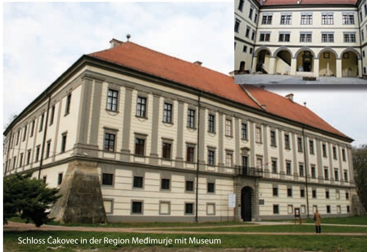
Schloss Čakovec in der Region Međimurje mit Museum

Jede Region wird durch drei Bilder von zeitgenössischen KünstlerInnen, welche von der Region selbst ausgewählt werden, vertreten. Das bedeutet, dass die Wanderausstellung sich aus 36 Bildern zusammensetzt. Diese Zusammenstellung wird einem interessierten Publikum in jeder Projektregion in Form einer zweimonatigen Wanderausstellung, präsentiert werden. Die Ausstellung findet in Zusammenarbeit mit regionalen Galerien und vor allem Museen statt. Die gesamte Ausstellung dauert 10 Monate. Ausstellungszeitraum: 1. Februar 2011 bis 30. November 2011 (10 Monate).