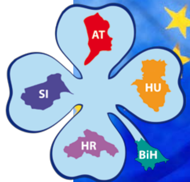
Projektlogo „Vierblättriges Glückskleeblatt“